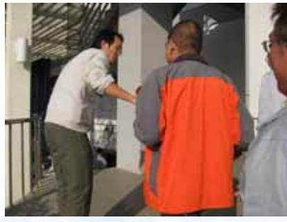
3. 安全防護班前往現場，於電梯前放置三角錐，並確認有無受困人員，確認受困一人