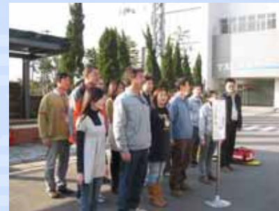
8. 應變同仁退至安全區集合點名