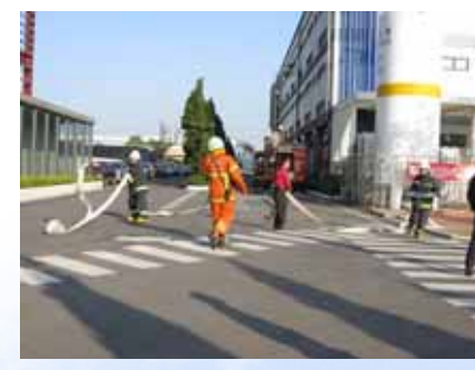
4. 消防車到廠，並進行中繼送水