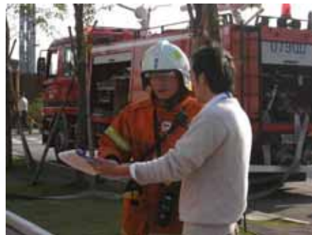
2. 與消防隊隊長回報現況