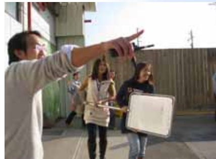
5. 通報聯絡班將安全指示牌帶至安全區設置