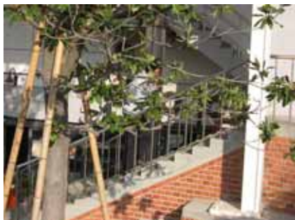
4. 安全防護班至現場斷電後到安全區待命