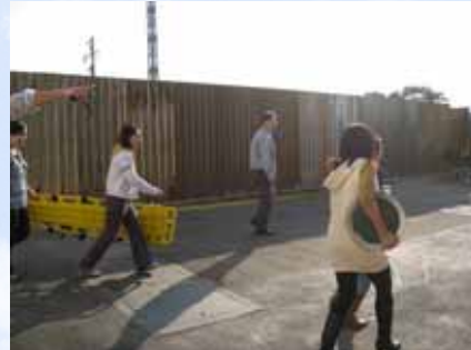
6. 救護班將擔架帶至安全區，並與護士會合