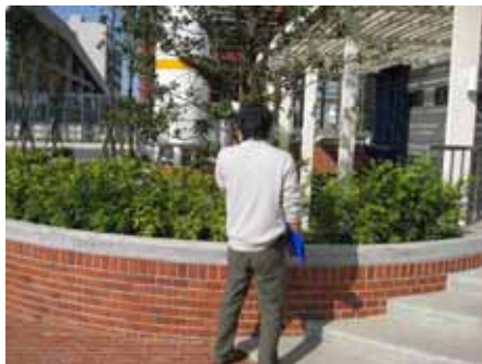
1. 指揮官通知山峰消防隊，火場受困一員