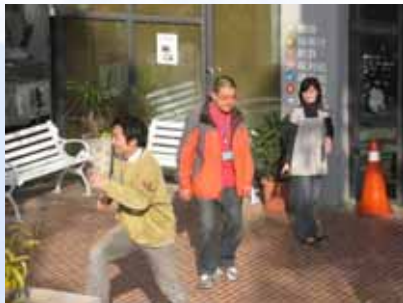
7. 滅火班見火勢無法控制，指揮官下令撤退至安全區集合