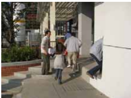
1. 滅火班及避難引導班前往救援及疏散