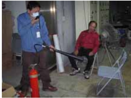
2. 滅火班對假想起火點滅火