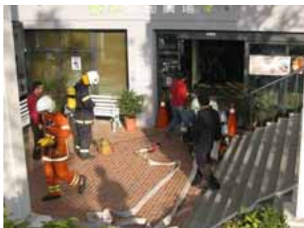
5. 穿戴裝備，準備進入火場，將受困人員救出，送上救護車，並將火勢熄滅