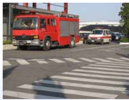
3. 化學車及救護車到廠