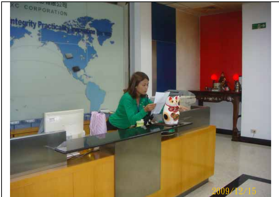
說明：總機廣播開始實施緊急應變演練。