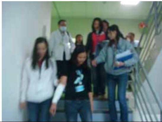
說明：將傷患攙扶離開現場。