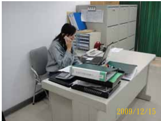
說明：單位主管通知醫務室及安衛單位