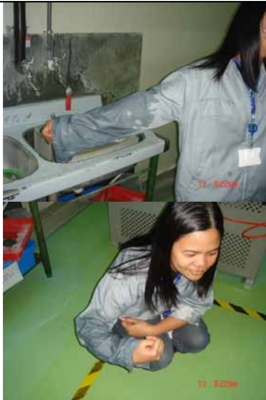
說明：模擬作業同仁遭 HF 噴濺。