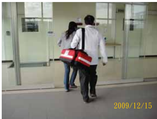
說明：駐廠醫師及護士趕至現場。